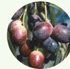
Comune di SAN VITO ROMANO Progetto Olio Rosciola