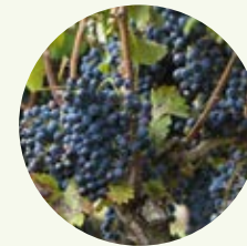
Comune di OLEVANO ROMANO Progetto Cultivar Cesanese

Grazie a questi tre progetti - in collaborazione con prestigiose Università e Enti di ricerca come il Crea e il Cnr, sotto la supervisione dell'Agenzia regionale per l'agricoltura Arsiat - sarà possibile tutelare e far conoscere questo grande patrimonio di biodiversità agraria che sta alla base di molte tradizionali realtà e che oggi può rappresentare la base per lo sviluppo di una nuova economia, sempre più inclusiva e rispettosa dell'ambiente.